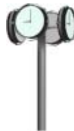
Version quatre face sur mât