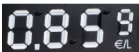
3 chiffres HW-9 + 1 chiffre HW-6 + €/L